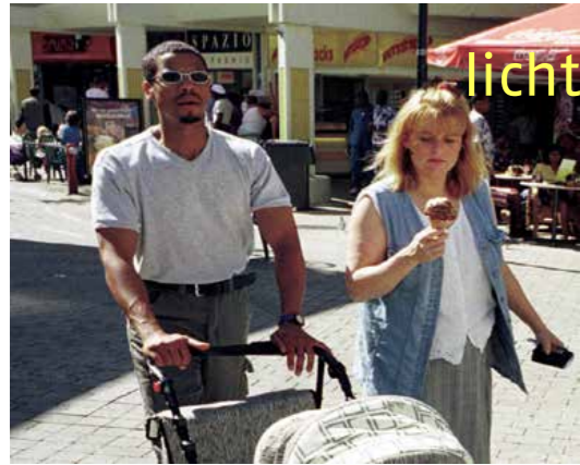
licht, lucht en ruimte