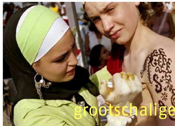
grootschalige succesvolle vernieuwing