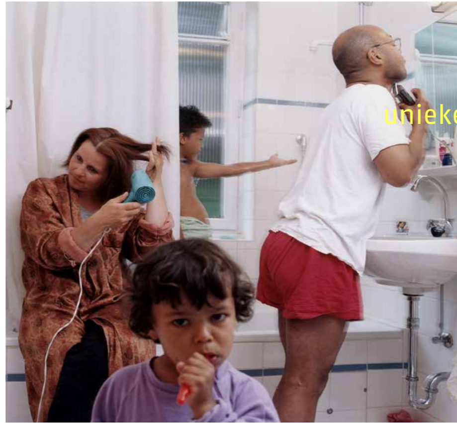
unieke kleurrijke stedelijkheid