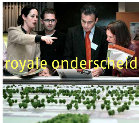
royale onderscheidende en betaalbare woningen