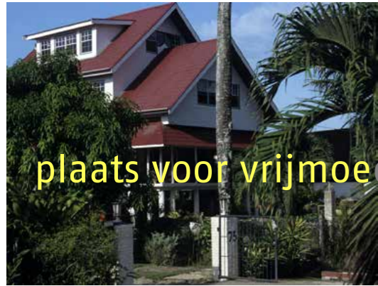
plaats voor vrijmoedige wereldburgers