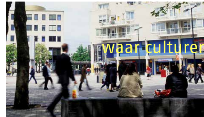
waar culturen elkaar echt raken