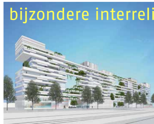
bijzondere interreligieuze tolerantie