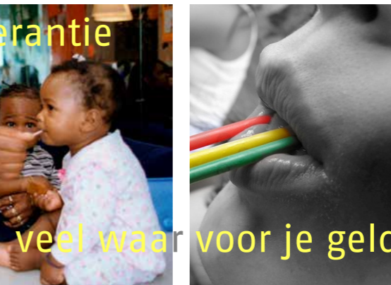
veel waar voor je geld op alle terreinen