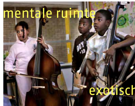
exotisch onderdeel van bruisend Amsterdam