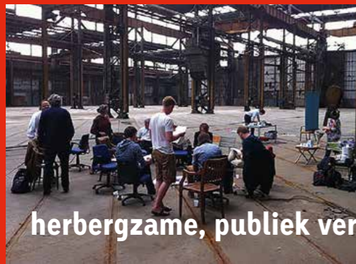
libraries reflect who we are and what we share