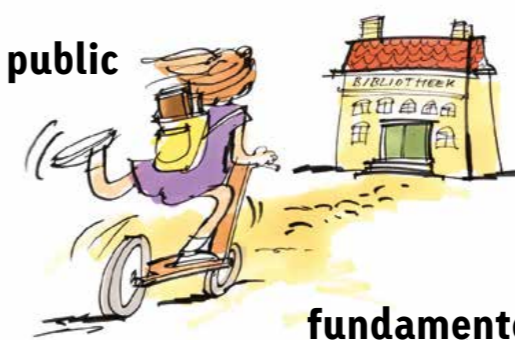
fundamenteel pluriforme stad