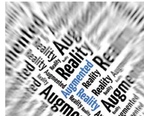
support bij achterstand én bron van verfijning