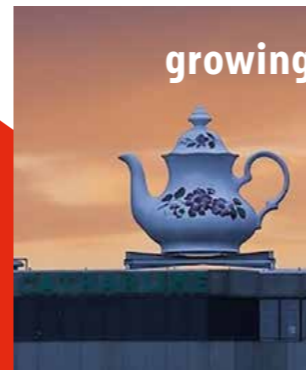
growing up in public