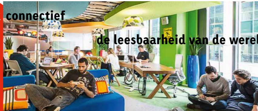
de leesbaarheid van de wereld is veranderd