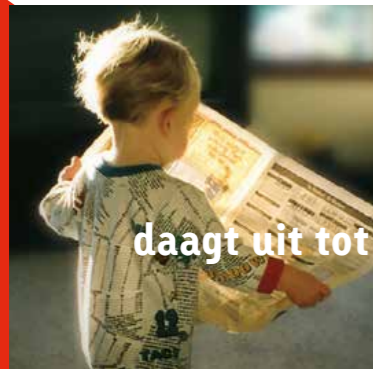
daagt uit tot het verleggen van grenzen