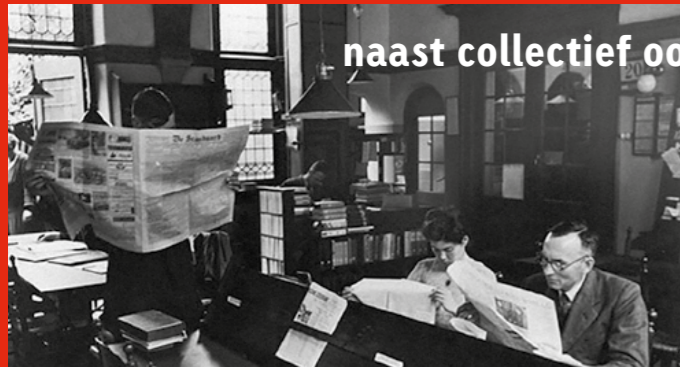
naast collectief ook connectief