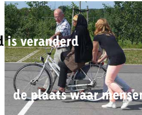
de plaats waar mensen samen kennis maken